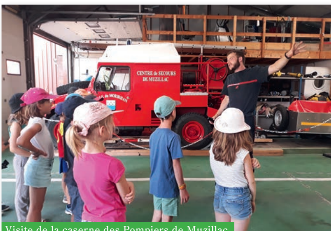
Visite de la caserne des Pompiers de Muzillac

Après avoir clôturé une année placée sous le thème des arts en folie par une exposition le 3 juillet, retraçant les différentes périodes de l'année et présentant de nombreuses activités réalisées par les enfants, l'accueil de loisirs a ouvert les portes de son camping Ty Moun le lundi 8 juillet 2019. Un été placé sous le signe des 4 éléments : l'eau, l'air, la terre et le feu. Et rythmé par des activités, temps forts et sorties.