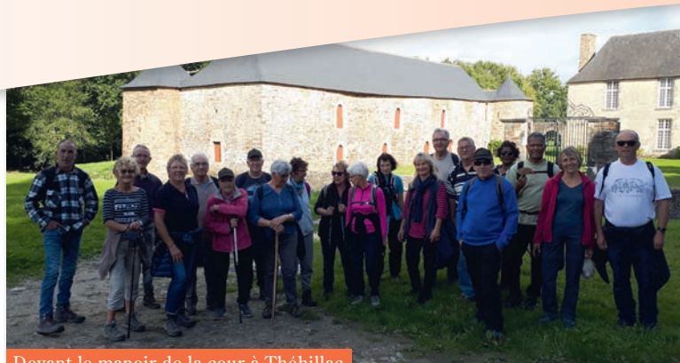
Devant le manoir de la cour à Théhillac

Venez découvrir avec nous les techniques de combat, de self défense dans la bonne humeur et le respect de l'adversaire.