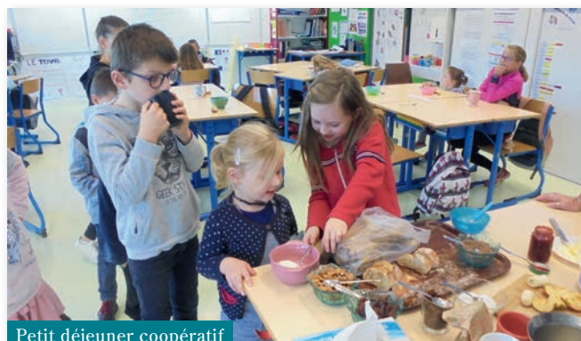
Petit déjeuner coopératif

Le « Vivre-Ensemble » est une notion fondamentale qui permettra en plus à chacun d'avancer dans ses apprentissages et de trouver son rythme tout en bénéficiant de l'appui des autres.