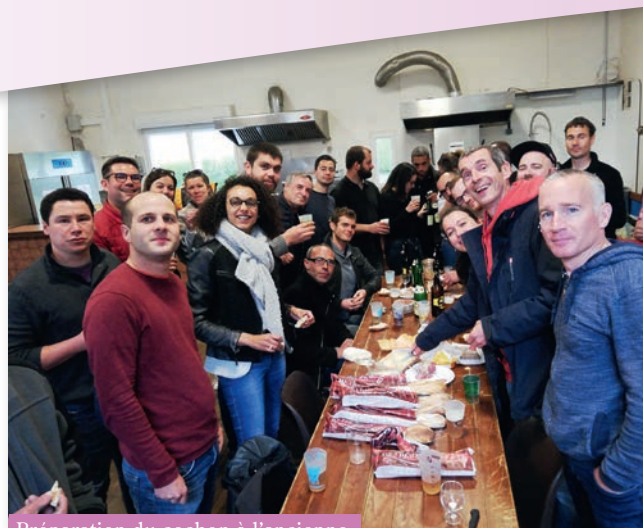
Préparation du cochon à l'ancienne

Petite nouveauté, un tournoi de jeu-vidéo sur le jeu FIFA organisé par des jeunes motivés a eu lieu le dimanche 27 octobre 2019. Très belle réussite pour une première.