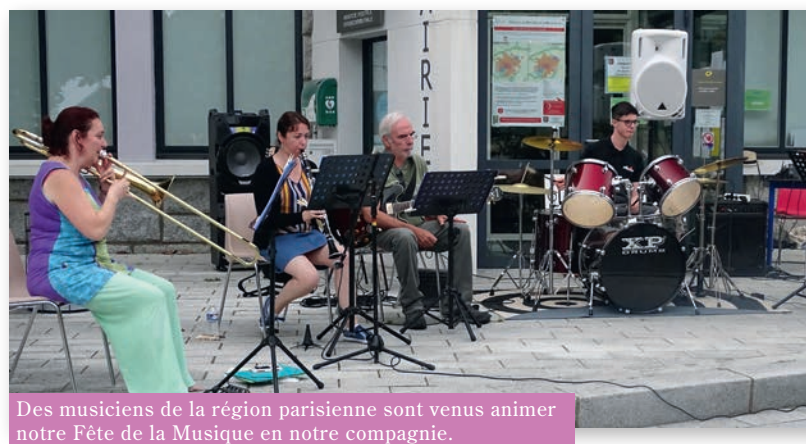
Des musiciens de la région parisienne sont venus animer notre Fête de la Musique en notre compagnie.