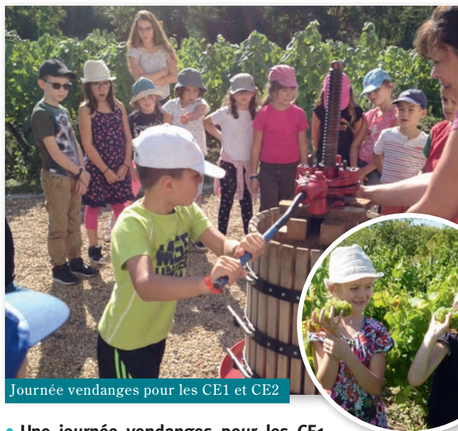
Journée vendanges pour les CE1 et CE2