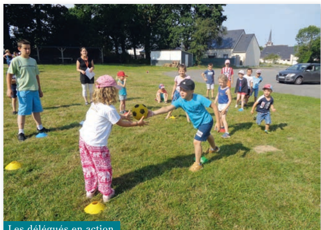
Les délégués en action

Ce voyage n'aurait pas été possible sans la collaboration des parents d'élèves qui ont assuré la sécurité et aidé à la logistique. ■