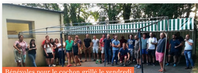
Bénévoles pour le cochon grillé le vendredi

Vous pouvez prendre contact avec nous à travers le site ou par mail au 5356048@ffhandball.net ou par téléphone au 06 11 95 20 58 .