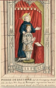
Pierre de Bretagne