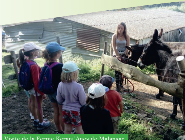
Visite de la Ferme Kerant'Anes de Malansac

Avec une fréquentation moins importante, le mois d'août ne fut pas en reste puisque les enfants ont visité la passe à poissons et le barrage d'Arzal et ont pu profiter d'un après-midi sur la plage de la Mine d'or à Pénestin. Ils