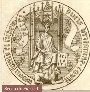
Sceau de Pierre II