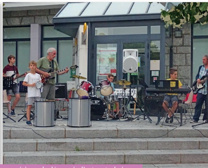
La Fête de la Musique fut l'occasion de jouer en groupe avec d'autres musiciens, de découvrir d'autres techniques.

C'est prématurément que la fin de la Musicalaise avait été annoncée. Certes, le découragement avait gravement impacté les 4 (QUATRE) membres du bureau qui, faute de bénévoles, effectuaient la totalité de l'organisation des diverses manifestations que l'association proposait. Certes, la décision était difficile à prendre après 14 années de travail, après s'être réjoui des progrès et des réussites des élèves, après s'être battu, année après année pour que vive La Musicalaise afin qu'elle puisse permettre au plus grand nombre, enfants et adultes, d'apprendre et de pratiquer la musique. L'ensemble de nos professeurs avaient privilégié d'autres activités, les locaux que nous avons quittés devaient bénéficier d'une réhabilitation complète, la disparition de La Musicalaise semblait inéluctable.