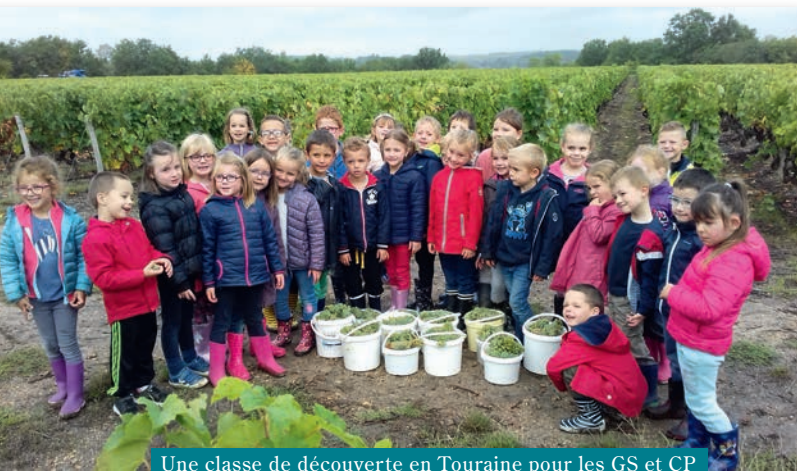
Une classe de découverte en Touraine pour les GS et CP