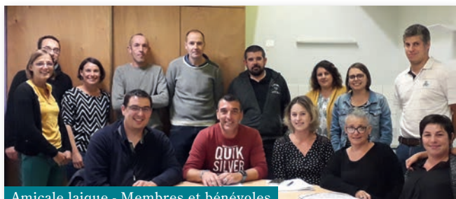
Amicale laïque - Membres et bénévoles

Tout au long de cette année 2019, l'amicale a fonctionné grâce au bénévolat des parents d'élèves, des membres du bureau et des enseignants de l'école Jean-Marie Boëffard. Toutes ces personnes contribuent à la vie de cette association où le maître mot est la convivialité.