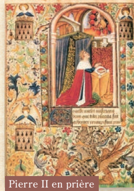
Pierre II en prière