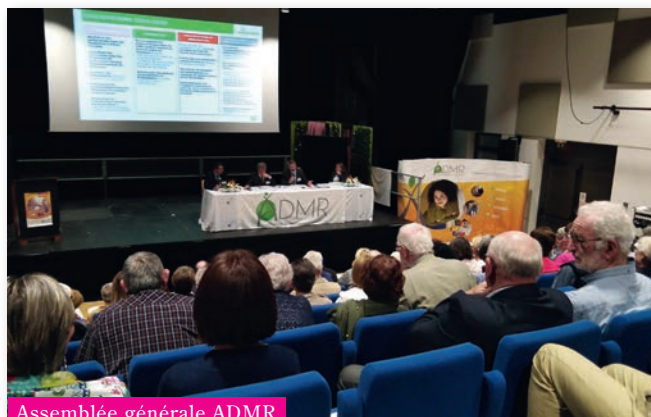
Assemblée générale ADMR

La commune de Malansac a accueilli le 18 juin 2019 le réseau ADMR du Morbihan pour l'assemblée générale de sa fédération.