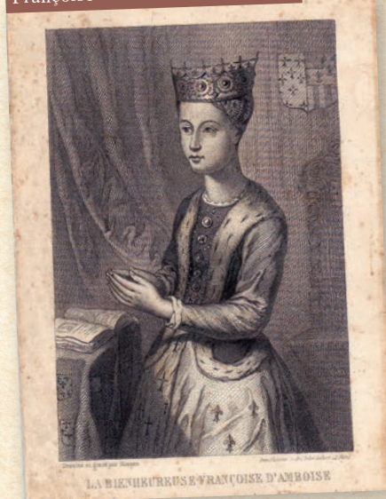
Françoise d'Amboise, son épouse

Il meurt le 22 septembre 1457 à Nantes. Le règne relativement court de ce duc n'a pas marqué l'histoire. Bien conseillé par sa femme, mais peu fait pour la fonction ducale, lourd d'esprit comme de corps, sujet à des sautes d'humeur et timide. À sa mort, son oncle sexagénaire Arthur de Richemont lui succède sous le nom d'Arthur III. ■