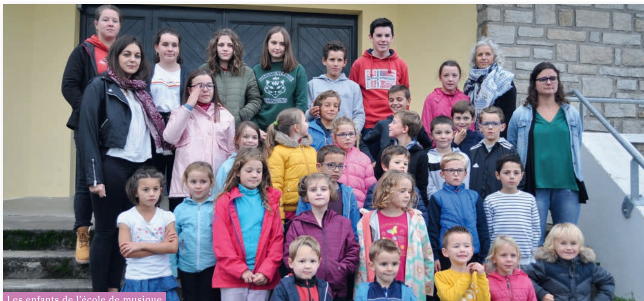
Les enfants de l'école de musique

C'est tout début septembre que la saison musicale a repris à la suite de notre traditionnel couscous qui, cette année encore, fut une grande réussite. L'école de musique a repris ses activités et fête ses dix années d'existence. Son organisation a été entièrement revue puisque les cours se tiennent à présent en semaine, les mardis et vendredis soirs. Des classes d'éveil musical et de guitare viennent se rajouter aux traditionnels cours de cuivres et de percussions. L'école de musique sous cette nouvelle formule accueille au total 34 élèves dont 21 nouveaux.