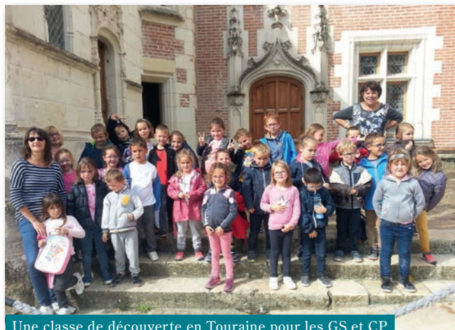
Une classe de découverte en Touraine pour les GS et CP