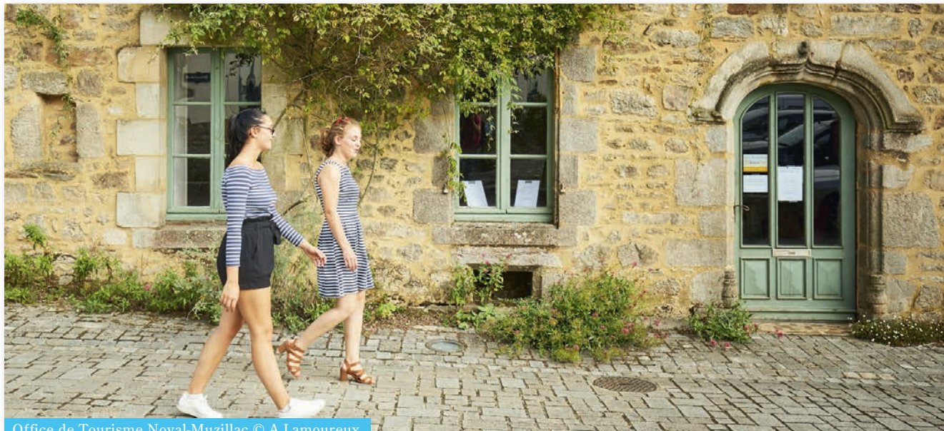
Office de Tourisme Noyal-Muzillac