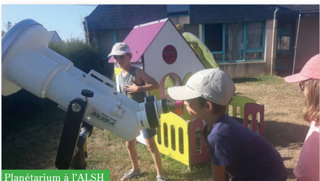
Planétarium à l'ALSH

Au mois de juillet les enfants ont pu visiter la caserne des pompiers de Muzillac pour une immersion au plus près de ces héros du quotidien, ils ont ensuite pris place dans un véritable planétarium installé dans les locaux de l'Alsh par l'association SPICA (Sciences et Phénomènes Insolites du Ciel et de l'Aéronautique). Ils ont pu visiter les éoliennes de Saint-Nazaire ainsi que plonger dans la Cité de la Voile de Lorient et le sous-marin, sensations garanties !