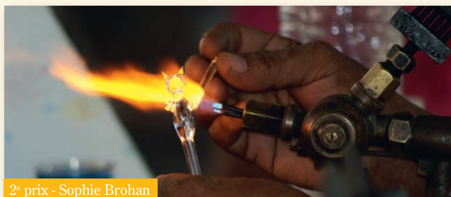
2 e prix - Sophie Brohan

Merci à tous les participants et rendez-vous l'année prochaine ! ■