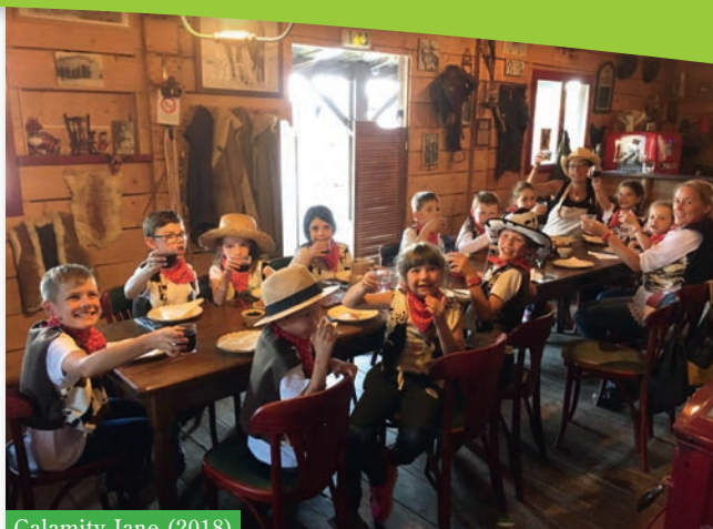
Calamity Jane (2018)

Comme nous l'avions indiqué lors de la réunion de présentation, cela permet une meilleure interface entre les familles et le service Enfance-Jeunesse. Celle-ci sera optimisée dans les mois à venir avec, nous l'espérons un usage accru des familles.