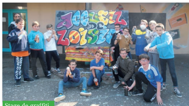
Stage de graffiti