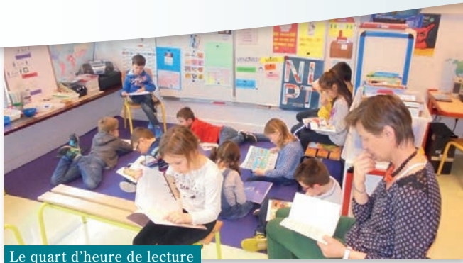
Le quart d'heure de lecture

simple de lire. C'est aussi un grand moment de calme qui permet d'entrer dans les apprentissages suivants en étant parfaitement mobilisé. Cette opération sera reconduite à la rentrée prochaine !