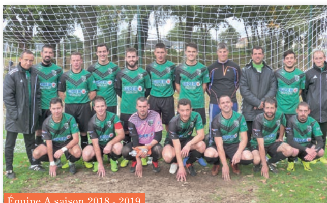
Équipe A saison 2018 - 2019

Nous remercions tous les dirigeants bénévoles qui œuvrent à nos différentes rencontres sportives indispensables au bon fonctionnement du club et aussi à tous nos bénévoles qui s'impliquent pour nos fêtes. La commission fêtes s'active sur la mise en place de nos diverses manifestations, la retransmission sur écran géant de quelques matchs de la coupe du monde féminine dans la salle de la Jeune France, et enfin la mise en place du loto et de la noce bretonne des 4 et 5 Août 2019. ■