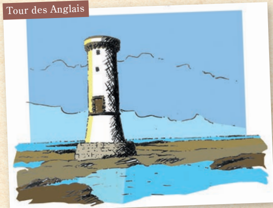
Tour des Anglais