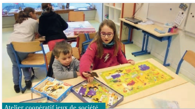
Atelier coopératif jeux de société

Chaque élève au sein de son équipe a pu participer à l'activité en coopérant avec les autres. Ainsi les plus grands ont pu apprendre des jeux de société, lire aux plus jeunes, les aider dans les différentes activités, mais aussi plus simplement participer aux activités avec eux.