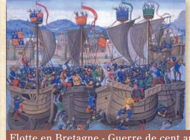
Flotte en Bretagne - Guerre de cent ans

Dans le précédent article, j'ai présenté le duc Jean V dont deux fils deviendront duc de Bretagne : François et Pierre sous les noms de François I er et Pierre II.