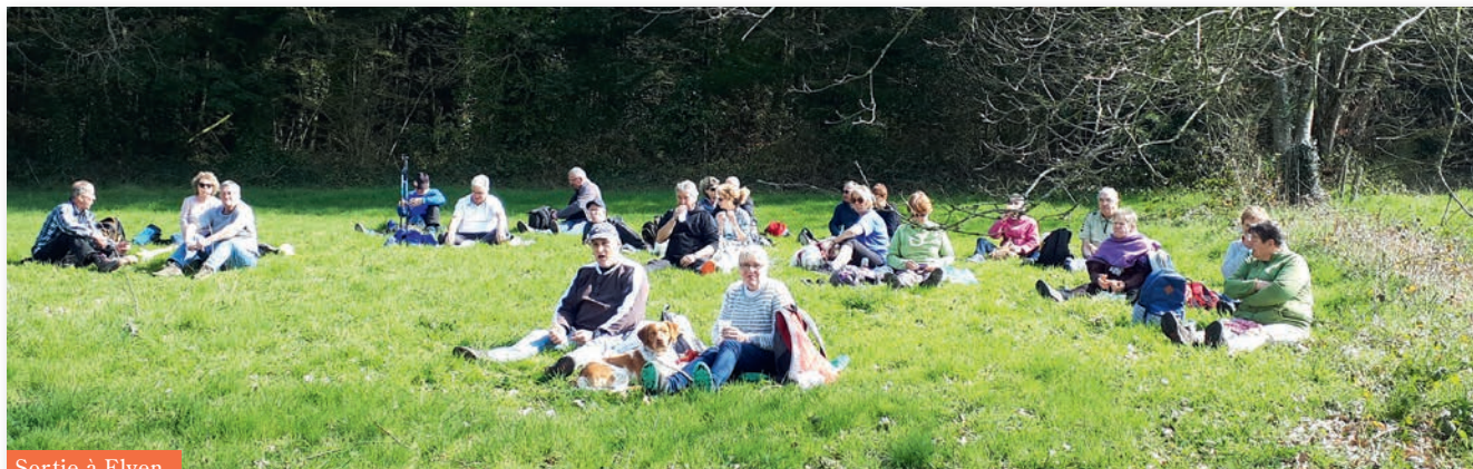
Sortie à Elven

Notre association grandit, plus de 100 adhérents, quelle réussite ! Elle nous comble de bonheur. Cela se ressent lors de nos diverses randonnées, l'ambiance est là et accompagne nos pas sur les sentiers divers et variés.