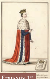
François 1 er