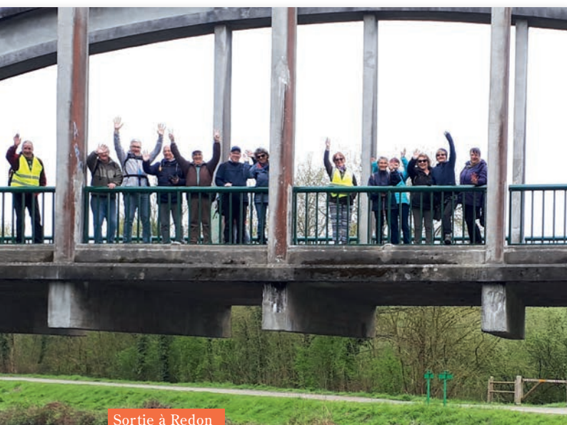
Sortie à Redon

Blog de l'association : https://agdsnoyalmuzillac.clubeo.com augredessentiers56@mail.co