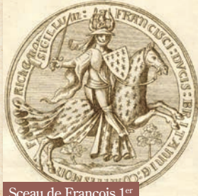
Sceau de François 1 er