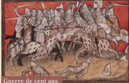
Guerre de cent ans