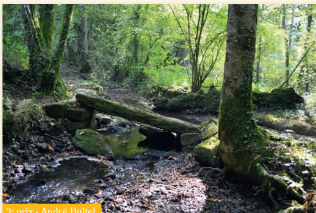
3 e prix - André Bultel